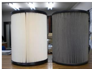
真っ黒で汚れが取れない状態（交換が必要です）