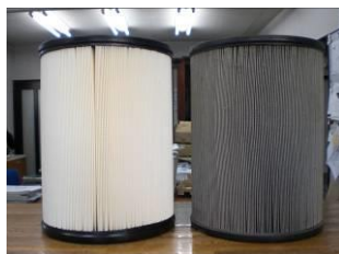
真っ黒で汚れが取れない状態（交換が必要です）