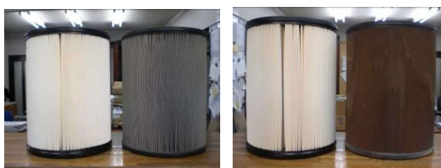
真っ黒で汚れが取れない状態（交換が必要です）