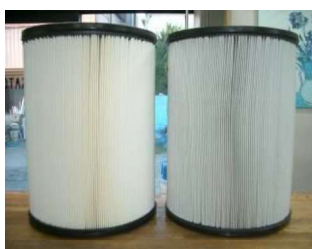
通常の清掃で十分な状態