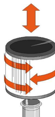
フィルターの外し方・つけ方