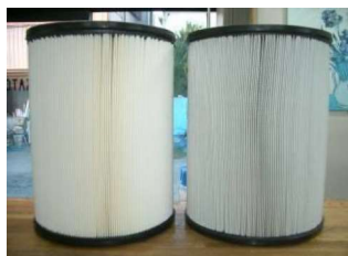
通常の清掃で十分な状態