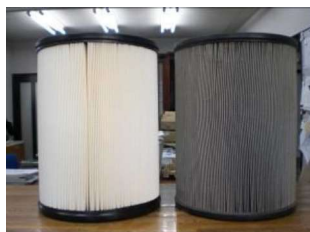
真っ黒で汚れが取れない状態（交換が必要です）